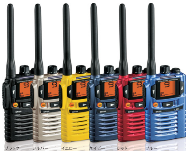
ブラック シルバー イエロー ネイビー レッド ブルー