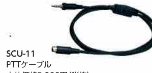
SCU-11 PTTケーブル 本体価格 3,000円(税抜)