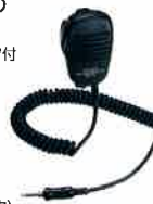
MH-57A4B スピーカーマイク 本体価格 4,700円(税抜)