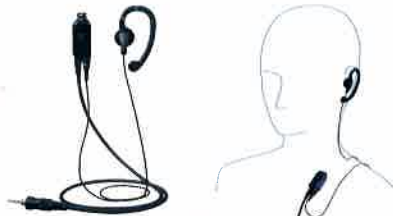
EK-313-107 小型タイプイヤホン(耳かけイヤホンタイプ) 本体価格 7,500円(税抜)