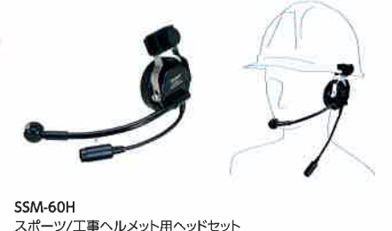
SSM-60H スポーツ/工事ヘルメット用ヘッドセット 本体価格 13,200円(税抜)

ヘルメットに装着するタイプのヘッドセット ※本体との接続にはSCU-11が必要です。