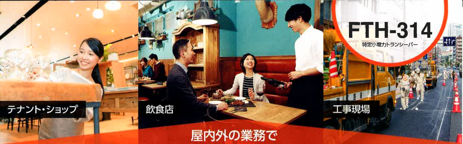
テナント・ショップ