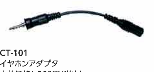
CT-101 イヤホンアダプタ 本体価格 1,300円(税抜)