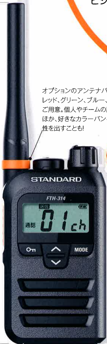
原寸大 (バックはロング アンテナモデル)