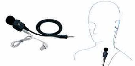
MH-62A4B タイプイヤホン(高感度タイプ) 本体価格 6,500円(税抜)