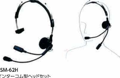
SSM-62H インターコム型ヘッドセット 本体価格 4,800円(税抜)

ヘルメットに装着するタイプのヘッドセット ※本体との接続にはSCU-11が必要です。