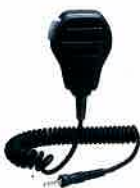
MH-73A4B 防湿型スピーカーマイク 本体価格 5,200円(税抜)