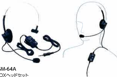
SSM-64A VOXヘッドセット 本体価格 8,000円(税抜)