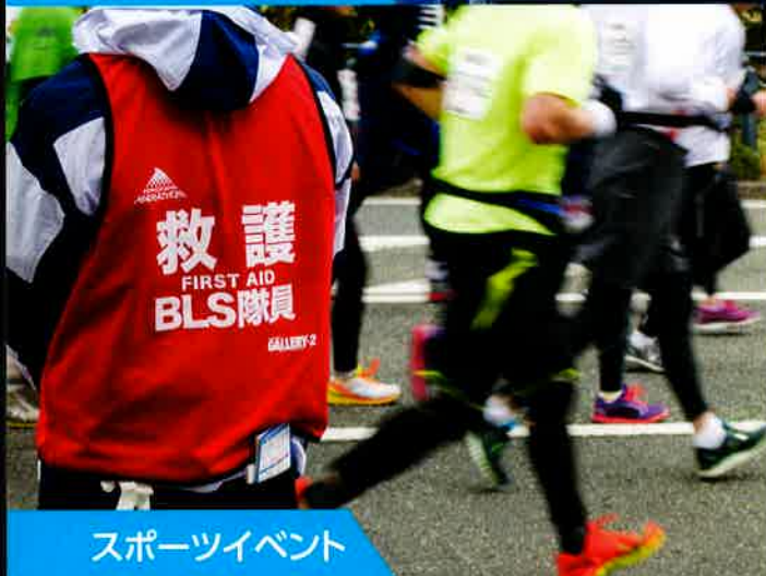
スポーツイベント