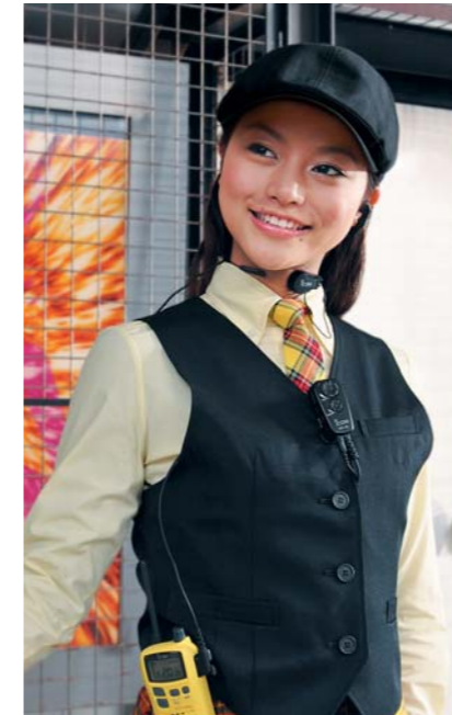
アミューズメント施設 お客様の誘導や、スタッフ間連絡の効率をアップ。 質の高いサービスを実現します。