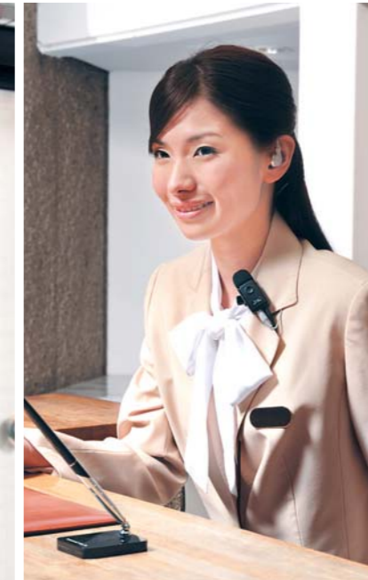
ホテル フロントとベルボーイなどの連携を強化。 効率的で行き届いたサービスを提供できます。