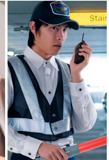
交通整理 交通状況をすばやく、確実に把握。 安全でスムーズな交通整理を実現します。