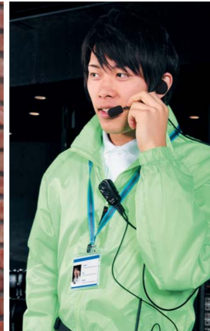
イベント会場 綿密なスタッフ間のコミュニケーションを実現。 円滑なイベント運営や安全確保につながります。