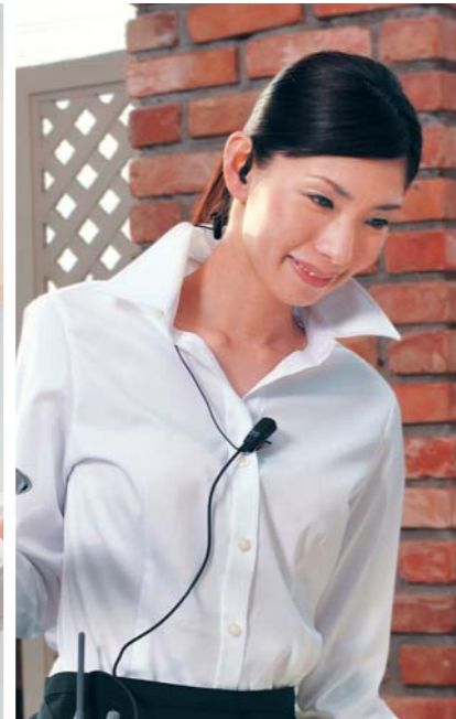
レストラン ホールと厨房間などの連絡を効率化。 注文にすばやく応じることができます。