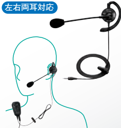
HS-99 ※VS-2Lが必要 耳掛け型イヤホンマイクロホン 4,000円+税 JANコード:4909723009375