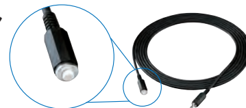
OPC-1856 リモートケーブル(約3m) 2,000円+税 JANコード:4909723009306

切り替えスイッチ▶ 高い場所に設置したあとでも手元で チャンネル切り替えが可能。