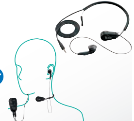
HS-97 ※VS-2Lが必要 咽喉マイクロホン 2,300円+税 JANコード:4909723810926