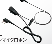
HM-177L 小型イヤホンマイクロホン 3,800円+税 JANコード:4909723007012