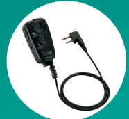
VS-2L PTT/VOXスイッチユニット 3,500円+税 JANコード:4909723009351