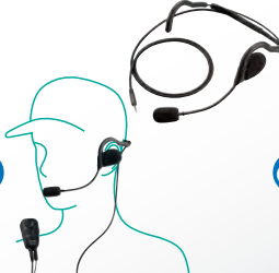
HS-95 ※VS-2Lが必要 ネックアーム型ヘッドセット 12,000円+税 JANコード:4909723810032