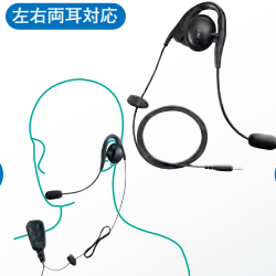
HS-94 ※VS-2Lが必要 イヤーフック型ヘッドセット 1,500円+税 JANコード:4909723809920