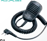
HM-186L 小型スピーカーマイクロホン 3,800円+税 JANコード:4909723009597